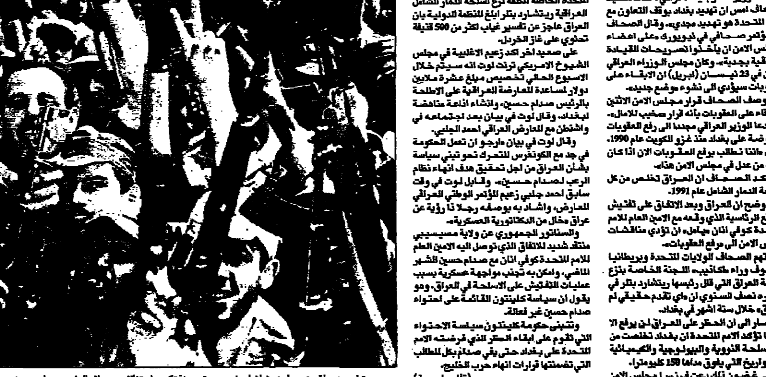
مترجون عراقيون يحملون رشاشات في مسيرة بعيد ميلاد الرئيس صدام حسين

■ بغداد - أعلنت حركة حزب البعث في بغداد مسيرة مسلحة بعيد ميلاد الرئيس العراقي صدام حسين في 29 نيسان (أبريل) في ردة على التفتيش الذي تقوم عليه الأمم المتحدة على العراق. وقال المتحدث باسم حركة البعث في بغداد إن مسيرة يوم غد ستشهد مشاركة 500 قذيفة «خردل» في ردة على التفتيش الذي تقوم عليه الأمم المتحدة على العراق. وقال المتحدث باسم حركة البعث في بغداد إن مسيرة يوم غد ستشهد مشاركة 500 قذيفة «خردل» في ردة على التفتيش الذي تقوم عليه الأمم المتحدة على العراق. وقال المتحدث باسم حركة البعث في بغداد إن مسيرة يوم غد ستشهد مشاركة 500 قذيفة «خردل» في ردة على التفتيش الذي تقوم عليه الأمم المتحدة على العراق.